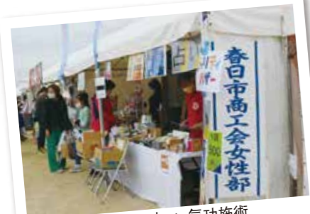
女性部は、占い、気功施術、手作り雑貨などで出店

今年の商工展は初めての占いや気功施術、またハンドメイドポーチ・バック等の販売もあり、今までと違った出店をさせて頂きました。お客様に大好評で女性部一同、笑顔で最後まで楽しく頑張りました。雨が降る中、お越し頂いた皆様ありがとうございました。