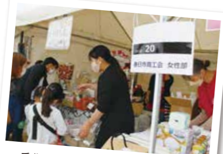
手作り雑貨も売れ行き好調でした