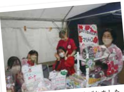
チャリティーバザーも喜ばれました