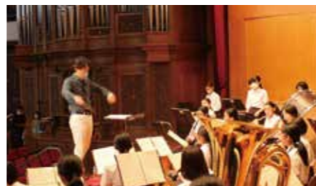
実際に指揮をして頂きました